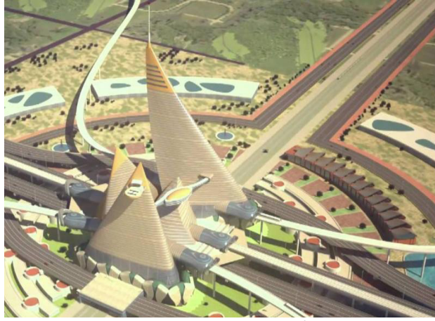
धोलेरा, गुजरात मध्ये प्रस्तावित 'स्मार्ट सिटी'

समजू शकेल की ज्या कष्टकरी जनतेमुळे त्यांच्या शहरांचा झगमगाट टिकून आहे, ती जनता त्यांचे आयुष्य अंधारात व्यतीत करत आहे. कामगार वस्त्यांमध्ये पहाटे लवकर उठून सुद्धा पाण्यासाठी रांगा लागलेल्या असतात. एवढे करून सुद्धा पिण्यासाठी स्वच्छ पाणी मिळत नाही. पिण्याचे पाणी बाटल्यांमध्ये भरून विकण्याचा धंदा तर कामगार वस्त्यांमध्ये सुद्धा मोठ्या प्रमाणात बहरला आहे. साहजिकच जेमतेम पोट भरण्यापुरते कमावणाऱ्या कष्टकरी जनतेला स्वच्छ पिण्याचे पाणी सुद्धा मिळत नाही. अशुद्ध व कमी पाणी