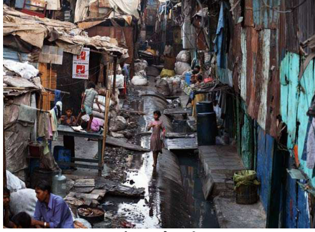
मुंबईत एका झोपडपट्टी

ह्या शहरांमधील गगनचुंबी इमारती व शॉपिंग मॉल्सच्या झगमगाटात आंधळा झालेला आणि कष्टकरी वर्गाशी कुठलेही सोयरसुतक नसलेला मध्यमवर्ग सामान्यपणे देशाबद्दल माहिती टीव्ही, वृत्तपत्रे व इंटरनेटच्या माध्यमातून गोळा करतो. ही मध्यमवर्गीय जमात विकसित होणाऱ्या शहरांचे वास्तव जाणून घेण्यासाठी जर कामगारांच्या वस्त्यांमध्ये जाण्याची हिम्मत करेल तर त्यांना