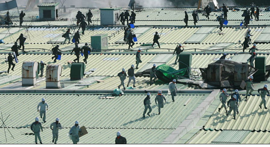
संप फोडण्यासाठी सशस्त्र पोलिसांनी केलेल्या भयंकर हत्याचा कामगारांनी खंबीरपणे सामना केला