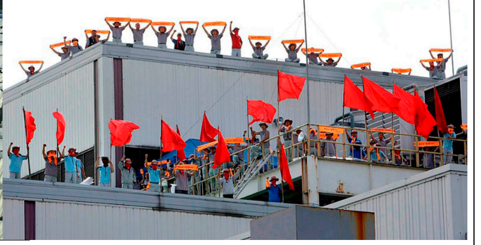
सांगयोंग मोटर फॅक्टरीच्या छतावर लाल झेंड्यासह उभे कामगार

दक्षिण कोरियाच्या सांगयोंग मोटर्स या कार कंपनीचे कामगार गेल्या ७ वर्षांपासून एक शानदार लढा देत आहेत. या सात वर्षांत त्यांनी सियोल शहरापाशी असलेल्या प्योंगतेक कारखान्यावर ७७ दिवस कब्जासुद्धा केला, राज्यसत्तेचे भयंकर दमन सोसले, कित्येक वेळा पराभवाला तोंड दिले मात्र आजसुद्धा ते आपल्या मागण्यांवर ठाम आहेत. दमन दुष्टचक्रात अडकून २००९ पासून आत्तापर्यंत २८ कामगार किंवा त्यांचे कुटुंबीय यांनी आत्महत्या केल्या आहेत किंवा ते मृत्यूमुखी पडले आहेत. तसे पाहता जगाच्या कोणत्याही कोपऱ्यात कामगार संघर्ष करत असतील तर तो संघर्ष फक्त त्यांचा राहत नाही, तर अवघ्या कामगार वर्गाचाच तो लढा असतो. सांगयोंग मोटर्सच्या कामगारांच्या सोबत उभे राहून भारतातील कामगार तर या संघर्षात अत्यंत महत्त्वपूर्ण भूमिका पार पाडू शकतात. सांगयोंग मोटर्सची मालकी एप्रिल २०१४ पासून भारतातील महिंद्रा अँड महिंद्रा ग्रुपसाठी आली आहे. भारतातील कामगारांचा पाठिंबा मिळवून महिंद्रा अँड महिंद्रा ग्रुपवर दबाव आणता येईल व या संघर्षात विजय मिळवता येईल म्हणून सप्टेंबर २०१५ मध्ये सांगयोंग मोटर्सचे कामगार दक्षिण कोरियाहून मुद्दामहून भारतात आले होते, परंतु सध्या तरी त्यांना प्रतिबंध हटण्याचे तोंडी आश्वासन घेऊनच माघारी जावे लागले आहे. अशी आश्वासने याआधीसुद्धा या कामगारांना मिळालेली आहेत, परंतु त्यांतून काहीही साध्य झालेले नाही. तरीही दक्षिण कोरियाचे हे कामगार आपला लढा शेवटच्या श्वासापर्यंत लढणार आहेत, आणि म्हणूनच भारतातील लढाऊ कामगार संघटनांनी या संघर्षात या कामगारांच्या पाठीशी उभे राहणे गरजेचे आहे.