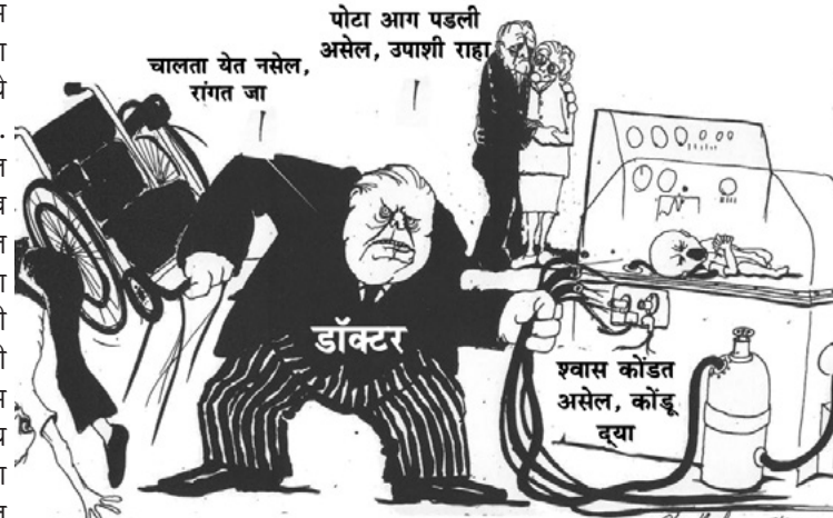
पण माझ्या नफ्याच्या आड येऊ नका

बरं, आता आरोग्यसेवेत गुंतवलेल्या पैशाबाबत बोलुयात. जागतिक आरोग्य संघटनेच्या शिफारशीनुसार, कुठल्याही देशाने त्याच्या सकल घरेलू उत्पादनाच्या अर्थात जीडीपीच्या कमीतकमी ५% खर्च आरोग्यावर केला पाहिजे. तुम्हाला माहिती आहे, भारतात किती होतो? गेल्या दोन दशकांत तो सतत १% च्या आसपास आहे. ११ व्या पंचवार्षिक योजनेत २% च उद्दीष्ट ठेवण्यात आलं होत, पण प्रत्यक्षात तो १.०९% इतकाच राहिला. १२व्या योजनेपूर्वीही सरकारने तशांचा एक गट बनवला होता, ज्यांनी या योजनेत, आरोग्य सेवेत जी.डी.पी.च्या २.५% गुंतवणूक करण्याची शिफारस केली होती पण सरकारद्वारे फक्त १.८५% चं उद्दीष्ट ठेवण्यात आलं. अजब आहे, सरकार भांडवलदारांना कित्येक लाख कोटीचं अनुदान, सूट देतं. पण