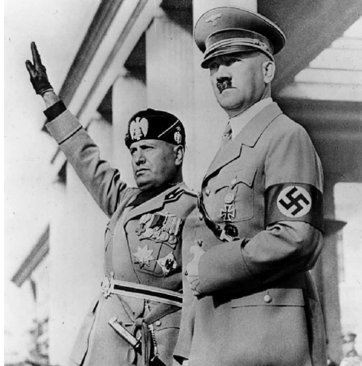
मुसोलिनी आणि हिटलर

समाजवादी आणि उदारमतवाद्यांना सर्वाधिक मते मिळाली, परंतु ते एकत्र सरकार बनवण्यास तयार नव्हते. समाजवाद्यांनी बोल्शेविक क्रांतीच्या प्रभावामुळे वेळेच्या अगोदरच सशस्त्र संघर्ष सुरू केला. १९१९-१९२० च्या दरम्यान इटलीच्या पो पर्वत रांगांमध्ये हा संघर्ष बराच पुढे गेला होता. समाजवाद्यांनी बऱ्याच शहरांवरती एक प्रकारे ताबा मिळवला होता. इटली गृहयुद्धाच्या वाटेवर असे, असेच वाटत होते. परंतु विद्रोहावर नियंत्रण ठेवण्यासाठी समाजवाद्यांनी ना स्वतःला तयार केले होता, ना जनतेला. त्यामुळे हा विद्रोह मोडून काढण्यात आला. हा विद्रोह चिरडण्यात भांडवली राज्यसत्तेची भूमिका होतीच, पण त्याच बरोबर फासीवादी सशस्त्र टोळ्यांनीसुद्धा या कामात महत्त्वपूर्ण भूमिका बजावली. १९१९ च्या निवडणुकांमध्ये फासीवाद्यांना उल्लेखनीय यश मिळाले नव्हते. परंतु १९१९-२० च्या कामगारांच्या विद्रोहाने मालमत्ताधारी वर्गाच्या मनात एक भीती निर्माण केली होती. रशियामध्ये पान ९ वर