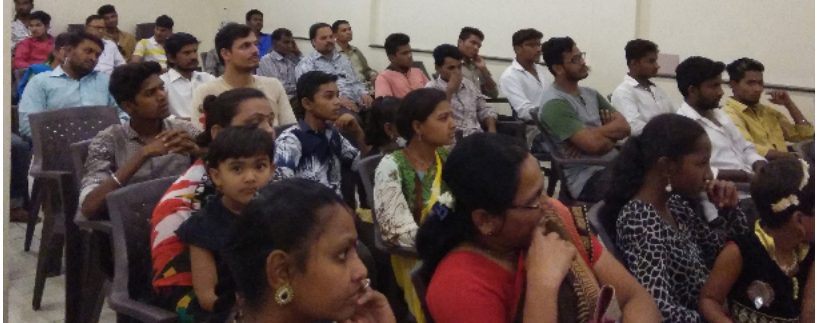
अहमदनगर येथे परिसंवाद आणि दोन पुस्तकांचा लोकार्पण कार्यक्रम

आला नव्हता. तरीदेखील भगतसिंह समजत होते की कशाप्रकारे जेव्हा भांडवलदार वर्ग जनतेला लुटण्यासाठी असाह्य व्हायला लागतो, तेव्हा तो लोकांना आपापसात लढवतो.