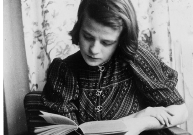
सोफी शोल हिचा मुळ फोटो

जानेवारी १९४३ साली 'व्हाइट रोज' च्या पाचव्या पत्रक 'जर्मन जनतेला आवाहन' च्या ६ हजार प्रति छापल्या गेल्या, संघटनेच्या सदस्यांनी आणि समर्थकांनी म्युनिखसह दक्षिण जर्मनीतल्या शहरांमध्ये वाटप केले. नंतर, गेस्टपो द्वारा चौकशी दरम्यान सोफीने सांगितले की १९४२च्या उन्हाळ्या पासूनच संघटनेचे ध्येय जास्तीत-जास्त जर्मन जनतेपर्यंत पोहचणे हे होते, म्हणूनच पत्रकातून संघटनेचे नाव बदलून 'जर्मन प्रतिकार आंदोलन' असे केले. या वेळेपर्यंत ते ठाम झाले होते की जर्मनी युद्ध जिंकू शकत नाही, म्हणून त्यांनी म्हटले "हिटलर युद्ध जिंकू शकत नाही, पण लांबवू शकतो." त्यांनी नाझी अमानवीयता, साम्राज्यवाद आणि प्रशियाई सैन्यवादावर हल्ला केला आणि अभिव्यक्ति स्वातंत्र्य तसेच अपराधी हुकूमशाही राजसत्ते पासून जनतेची सुरक्षा करण्यासाठी जर्मन प्रतिकार आंदोलनात