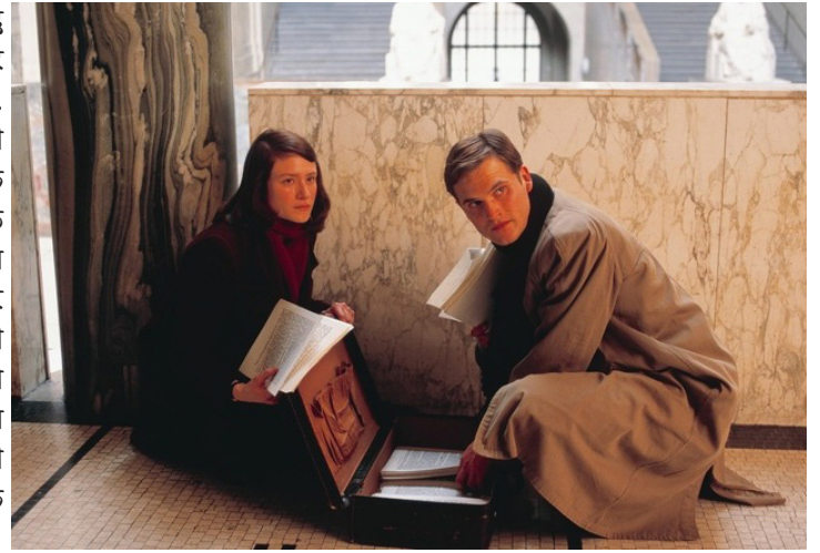
चित्रपट 'सोफी शोल - द फाइनल डेज' या मधील एक दृश्य

'व्हाइट रोज' संघटनेच्या बहुतेक सभासदांना अटक करून वेगवेगळे खटले चालवत कोणाला मृत्युदंड तर कोणास जन्मठेपेची शिक्षा देण्यात