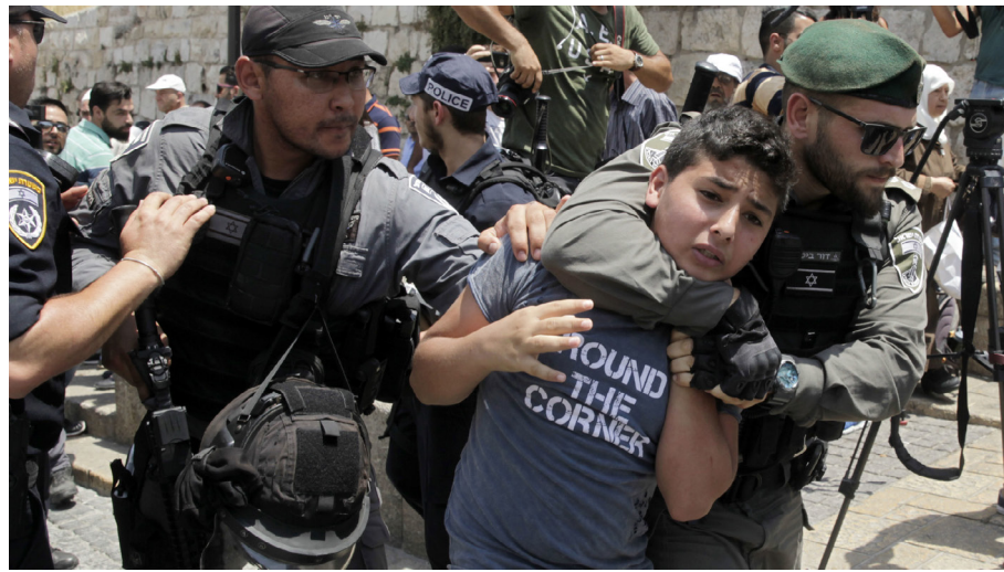
इस्त्रायल जगातील एकमेव देश आहे जो लहान मुलांविरुद्धही सैनिकी कायदा आणि शासन लागू करतो. दरवर्षी वय वर्षे १२ पासूनच्या जवळपास ५०० ते ७०० मुलांवर सैनिकी कोर्टांमध्ये खटले चालवले जातात

वेस्ट बँक व गाझापट्टीत इस्त्रायली धोरणे आणि कृतीमध्ये संचारबंदी, घरे उध्वस्त करणे, रस्ते-शाळा-सामुदायिक संस्था बंद करणे अशा सामूहिक शिक्षांचा मोठ्या प्रमाणात वापर झाला आहे. शेकडो पॅलेस्टिनी राजकीय कार्यकर्त्यांना जॉर्डन किंवा लेबननमध्ये निष्कासित करण्यात आले आहे. १९६७ नंतर इस्त्रायलने कैद केलेल्या पॅलेस्टिनींची संख्या आता जवळपास १० लाख झाली आहे. लाखो कैद्यांना तुरुंगात डांबले गेले आहे, काहींना खटल्याशिवाय (प्रशासकीय स्थानबद्धता), आणि बहुतेक जणांना इस्त्रायली लष्करी न्यायालयांकडून. ४०% पेक्षा जास्त पॅलेस्टिनी पुरुष एकदातरी कैद झाले आहेत. १९७१ नंतर पॅलेस्टिनी कैद्यांचा छळनित्यनियमाचा