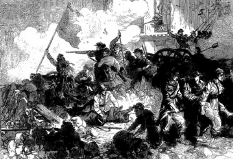
वीर कम्युनार्डानी सेनेचा जबरदस्त मुकाबला केला. एका बॅरिकेड वर लढणारी स्त्री कामगार.

3. जगातील या पहिल्या कामगार सरकारची स्थापना भांडवली राज्यातील नोकरशाही पूर्णपणे बरखास्त करून खऱ्या सार्वत्रिक मताधिकाराने झाली. स्थापनेनंतर टेलर, न्हावी, चर्मकार, प्रेस कामगार हे सर्व कम्युनचे सभासद म्हणून निवडले गेले. कम्युनला कार्यपालिका आणि न्यायपालिका म्हणजेच सरकार आणि संसद या दोघाचेही काम करायचे होते. जुन्या पोलीस आणि सेनेला बरखास्त केले गेले आणि सर्व कष्टकरी जनतेला शस्त्रसज्ज करण्याचे काम सुरू झाले. सत्तेवर आल्यावर दोनच दिवसात जुन्या सरकारचे सगळे बदनाम कायदे कम्युनने रद्द केले. कम्युनने पहिल्यांदा वास्तविक धर्मनिरपेक्ष लोकशाही साकार करून हे घोषित केले की धर्म हा प्रत्येक व्यक्तीचा खाजगी मामला आहे आणि राज्यसत्ता वा सरकारला यापासून दूर ठेवले जाईल. कम्युन मध्ये सर्वाधिक महत्वपूर्ण हुद्दे आणि जबाबदारी घेणाऱ्या व्यक्तींनाही कोणतेही विशेषाधिकार नव्हते. कामगार आणि अधिकारी, मंत्री यांच्या पगारात भांडवलशाहीत जी मोठी तफावत होती ती काढून टाकली गेली. पॅरिस कम्युनमध्ये साधारण कामगार जनसमुदायच वास्तविक मालक व शासक होते. कम्युन असेपर्यंत जनसमुदाय मोठ्या प्रमाणात संघटित होते आणि सर्व महत्त्वाच्या राजकीय प्रश्नांवर लोक आपापल्या संघटनांमध्ये चर्चा करत असत.