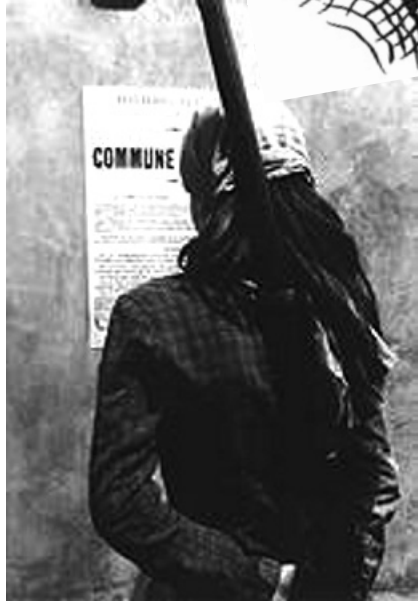
कम्युन मार्फत प्रसारित पोस्टर वाचताना एक कम्युनार्ड

सुरवातीला सरकारी सैन्याने नॅशनल गार्ड आणि जनतेवर हल्ला केला आणि त्यांच्या तोफा हिसकावण्याचा प्रयत्न केला. परंतु जनतेमध्ये क्रांतिकारी चैतन्य निर्माण झाले होते आणि कामगार लढण्यासाठी पूर्णपणे तयार होते. त्यांनी मोक्याच्या जागोजागी रस्त्यांवर अडथळे (बॅरिकेड) लावले होते आणि शेंकड्यांच्या संख्येने ते लढायला सज्ज झाले होते. वरील आणि खालील चित्रात मोंतमार्ल व एका अन्य ठिकाणी आपल्या आघाडीवर खंबीरपणे उभे असलेले कामगार आणि नॅशनल गार्डचे सदस्य दिसत आहेत. सर्व जागी थियेरशी इमानदार असलेल्या सैन्याच्या तुकड्यांना मागे ढकलले गेले.